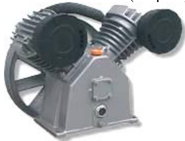
Узел насоса LB50 (старый)